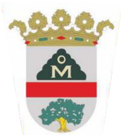
AYUNTAMIENTO DE MONEGRILLO