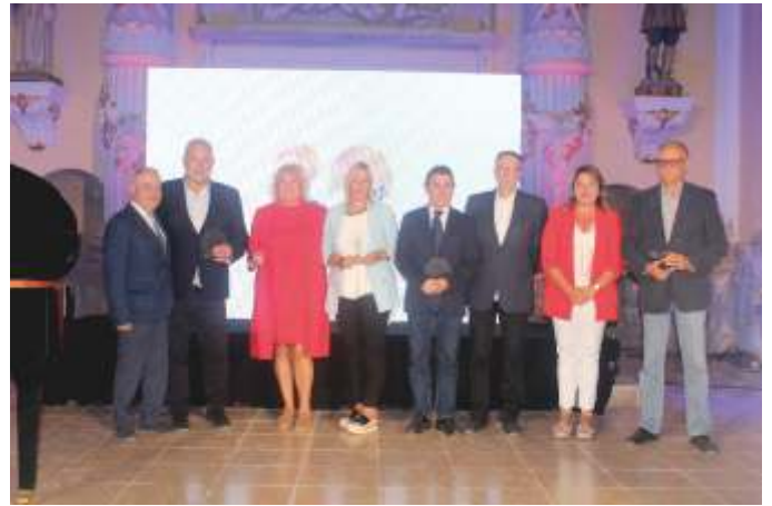
Distinción de Embajadores de Monegros

que se completa con elementos multisensoriales y un audiovisual que evocan nuestro paisaje y la personalidad de Los Monegros. Vemos cómo la tierra la hacen los que la viven, importa poco el tiempo que lleven aquí; la forjan los que se pierden entre sus calles, la gente que apuesta por vivir en su tierra y los que la cuidan, escriben su historia.