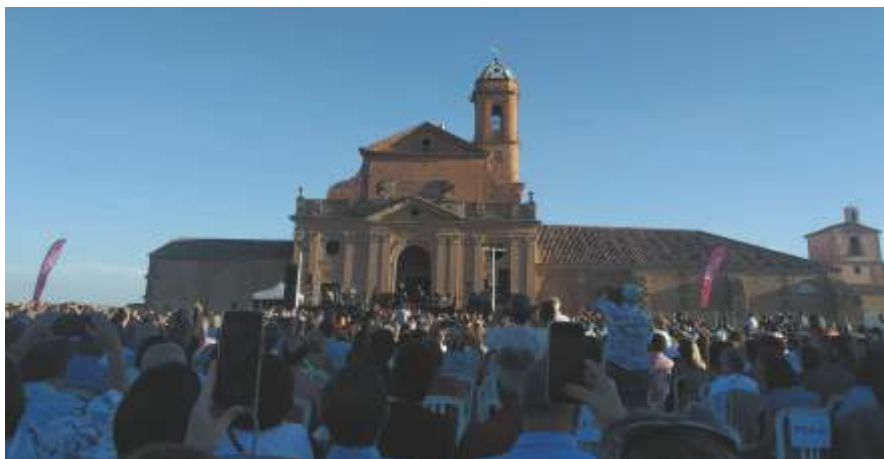
Concierto en La Cartuja

con su magnífico concierto y terminó con “El río”, “Santa Lucía” y el “Himno a la alegría”, toda una muestra de veteranía de este mito del rock español.