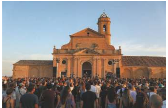
Manu Chao concierto