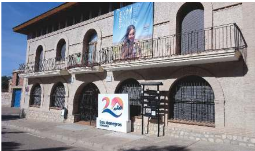
Exposición en Perdiguera

cal, formada por 180 trabajadores entre todas las áreas. También agradeció su trabajo a todos los consejeros de la comarca, a los 31 ayuntamientos del territorio y los 18.447 habitantes del mismo que forman “el motor de un territorio vivo”.