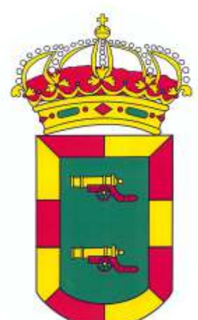
AYUNTAMIENTO DE ALCUBIERRE