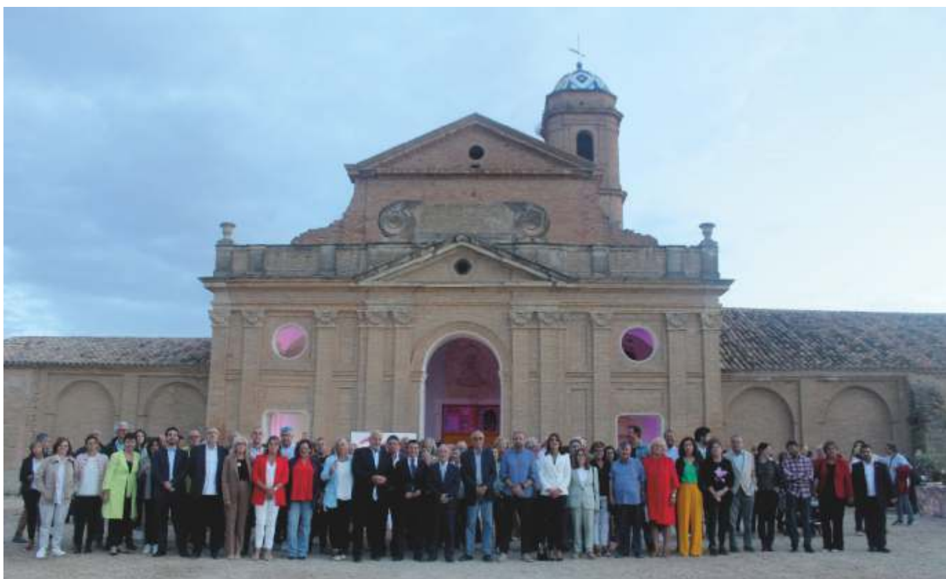
Foto de grupo en La Cartuja, acto del 7 de septiembre

Una foto de familia frente a la fachada de la iglesia sirve de recuerdo de este acto y también para recordar que se cumple el XX Aniversario de la declaración de La Cartuja de Las Fuentes como Bien de Interés Cultural.