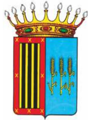
AYUNTAMIENTO DE FARLETE