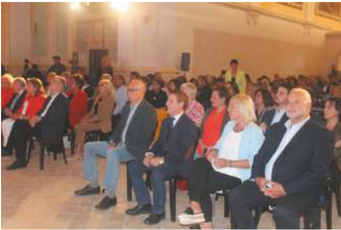
Autoridades y asistentes al acto