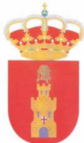
AYUNTAMIENTO DE BUJARALOZ