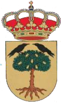
AYUNTAMIENTO DE LECIÑENA