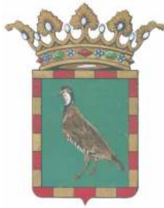
AYUNTAMIENTO DE PERDIGUERA