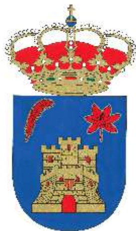
AYUNTAMIENTO DE LA ALMOLDA