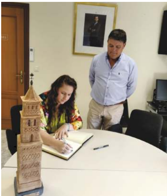
Judit Polgar firma en el Libro de Honor

el ajedrez como herramienta educativa a los niños en escuelas de todo el mundo, señalando que “este deporte ciencia es un juego mental en el que no debe haber separación entre hombres y mujeres”.